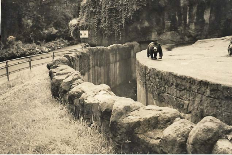
Fig. 2. Imatge del tancat dels ossos del Zoo de Vincennes inclosa a la «Memòria Descriptiva».

preses vives per alimentar animals. Aquesta visita ens mostra com Jonch i Vega es presentaven en els zooks europeus com a representants del Zoo de Barcelona, i, com a tals, els feien visites guiades en què podien observar detalls amagats dels zooks i entrar en contacte amb els dirigents dels mateixos.